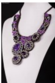
Colier Fantasy cu mărgelile din pietre agat violet