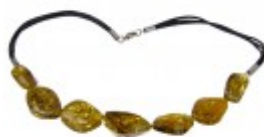
Colier unicat cu mărgelile din chihlimbar baltic verde