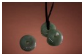
Pandantiv donut din aventurin cu diametru de 30 mm