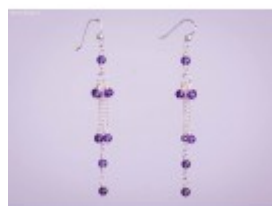
Cersei lungi din argint cu mărgelile mici din ametist