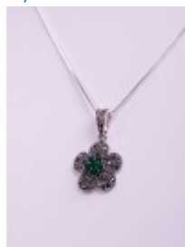
Pandantiv din argint în formă de floare cu agat verde