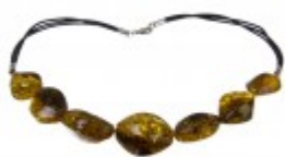
Colier unicat cu mărgelile ovale din chihlimbar verde