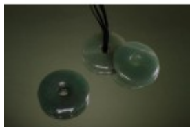
Pandantiv donut din aventurin cu diametru de 50 mm