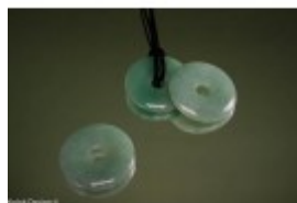
Pandantiv donut din aventurin cu diametru de 40 mm