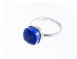
Inel din argint 925 cu lapis lazuli 7