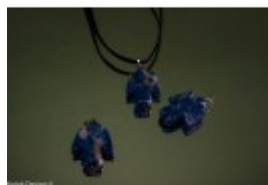
Pandantiv plat din sodalit, în formă de îngerăș