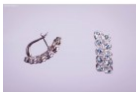
Cersei duble din argint cu pietre de topaz albastru