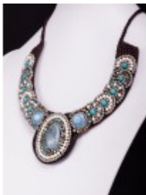
Colier Fantasy ajustabil cu mărgelile din cuarț albastru deschis