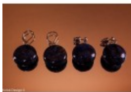
Cersei sodalit cu mărgelile rotunde și plate, cu cârlig