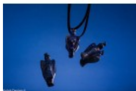
Pandantiv din lapis lazuli în formă de îngerăș