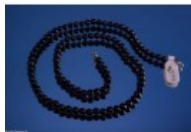
Colier goldstone albastru cu mărgelile rotunde 6mm