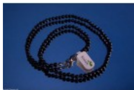
Colier goldstone albastru cu mărgelile rotunde 4mm