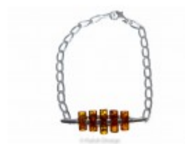
Brățară cu lăntișor masiv din argint cu chihlimbar baltic