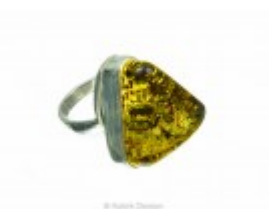
Inel unicat argint cu chihlimbar baltic verde triangular, 7