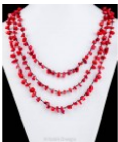
Colier lung din sfoară cerată și pietre de coral spongios