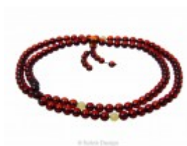
Mătânii Budiste din mărgelile rotunde de chihlimbar vișiniu