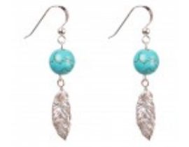
Cersei din argint cu pene și bile de turcoaz rec.