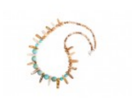
Colier Tribal cu mărgelile de turcoaz și jasp peisaj