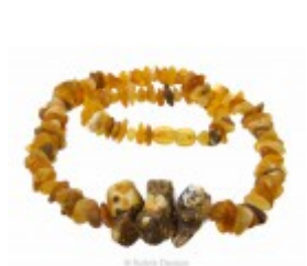
Colier Tribal cu mărgelile neșlefuite din chihlimbar miere