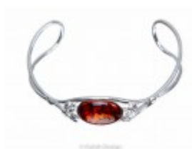
Brățară rigidă argint cu o piatră ovală de chihlimbar coniac