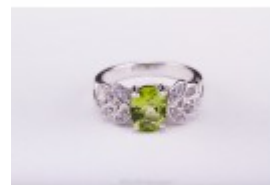
Inel din argint cu peridot și zirconia