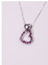
Pandantiv din argint în formă de inimă cu pietricele granat