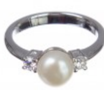
Inel din argint cu perle de cultură