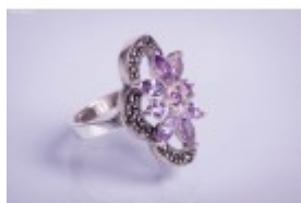
Inel din argint cu floare din ametist