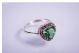
Inel inimă din argint cu turmalin verde