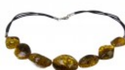
Colier unicat cu mărgelile ovale din chihlimbar verde