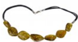
Colier unicat cu mărgelile din chihlimbar baltic verde