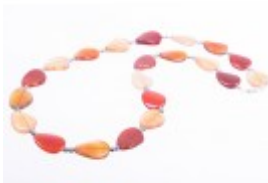
Colier lung cu carneol și hematit