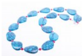
Colier statement cu coral și turcoaz reconstituit