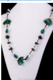
Colier lung din pietre multiple și sfoară cerată