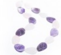
Colier statement cu cuarț roz și ametist