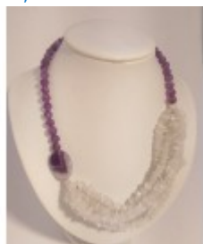
Colier asimetric REGINA LUNII cu piatra lunii și ametist