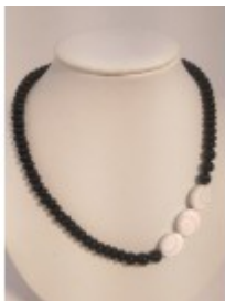
Colier CHARM din mărgelile de onix și scoică shiva