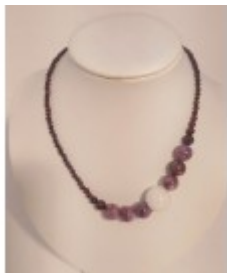
Colier ELEGANCE din mărgelile de granat, agat și jad