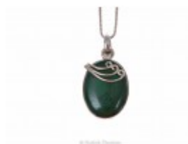
Pandant oval din argint 925 cu o piatră de malachit