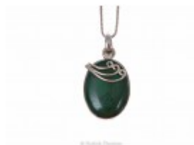
Pandant oval din argint 925 cu o piatră de malachit